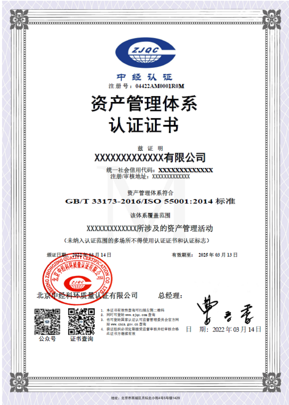
附件：资产管理管理体系认证证书样式