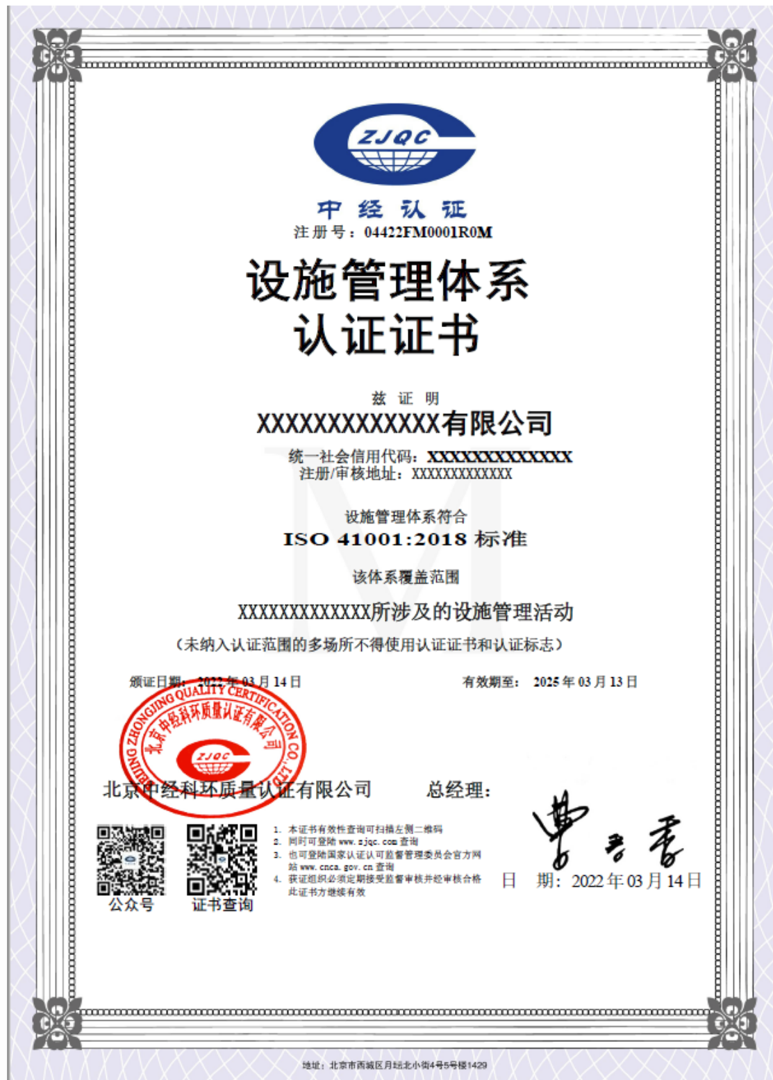
设施管理体系证书模板 中文