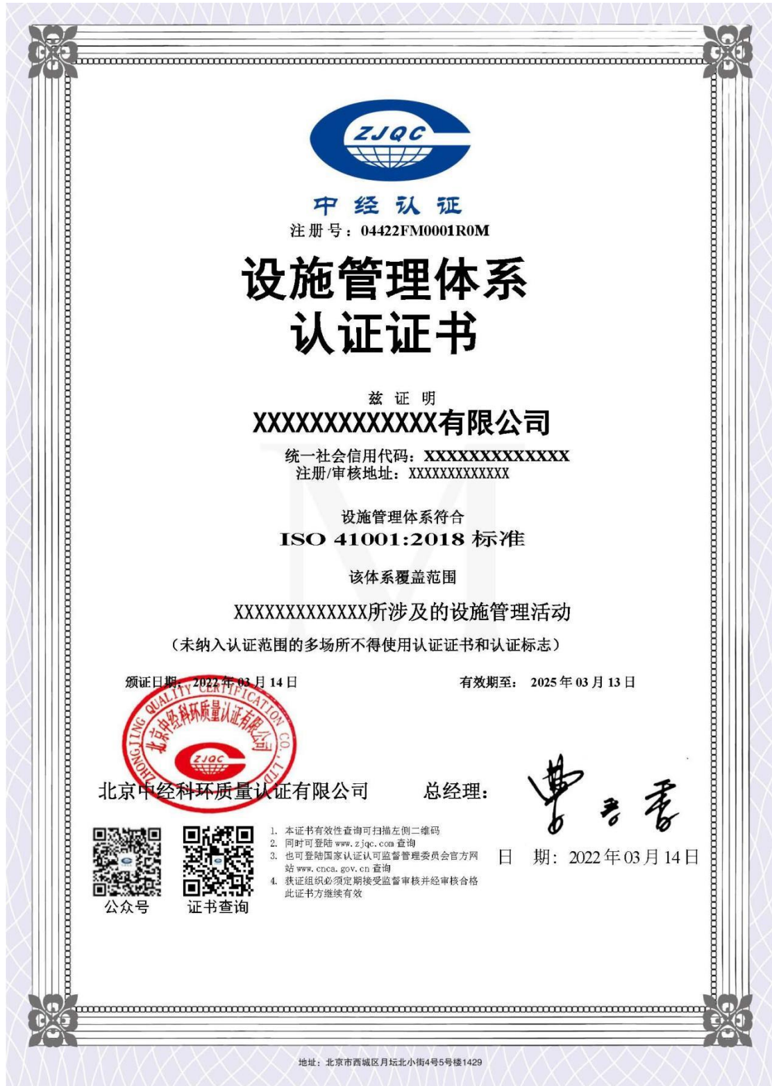
设施管理体系证书模板 中文